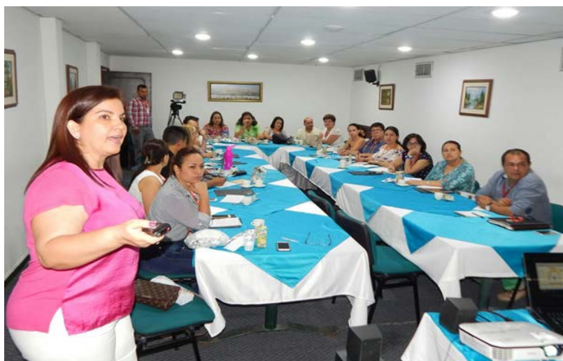
“Control Fiscal con Sentido Público”