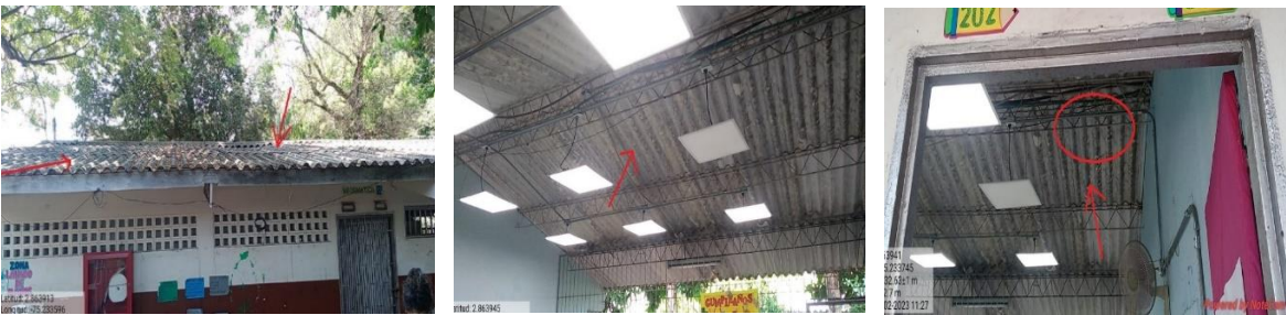
Continuación imagen 15-22. Estado actual Sede Primaria.....