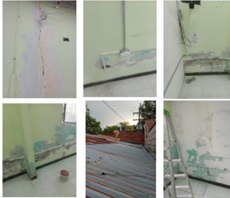
Imágenes del 1-6. Estado Después de la ejecución del contrato 005 del 2022