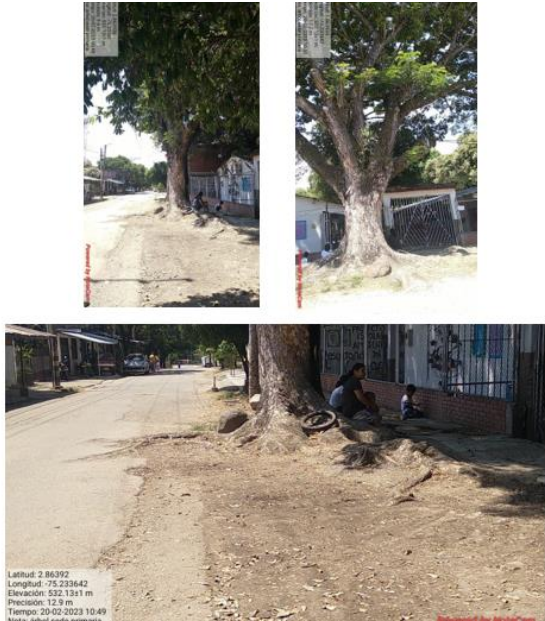
Imagen 12-14. Estado actual Árbol Sede Primaria

Cubierta en asbesto cemento de todas las aulas, levantamiento y fractura de los andenes en los corredores, levantamiento y fractura de los pisos internos de la sede primaria por obstrucción de raíces, desprendimiento de láminas de cielo raso en PVC, humedad bajo el soporte de los tanques de almacenamiento de agua.