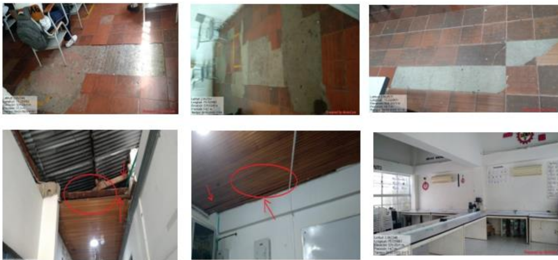
Imagen 6-11. Estado actual Bloque 2

Bloque nuevo: se evidencio el desprendimiento de baldosas en gres, aulas de informática, aulas del Sena, aulas de informática grados 1001,1002, desprendimiento del cielo raso en machimbre a la entrada y al interior del aula de clase.