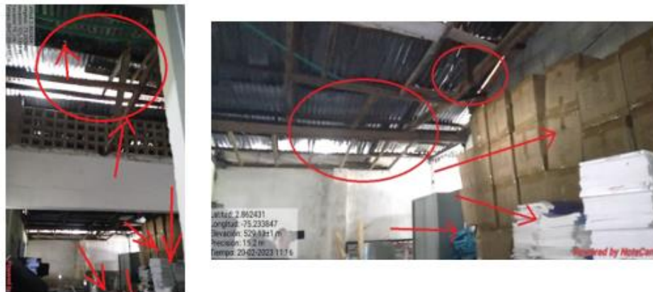
Imagen 2-3. Estado actual Bodega

Árbol con un diámetro en el tronco de aproximadamente 50 cm y una altura de 10 metros y ramas extendidas de aproximadamente 4 metros ubicado entre las aulas 601, grado 11, 701, 901 y 702.