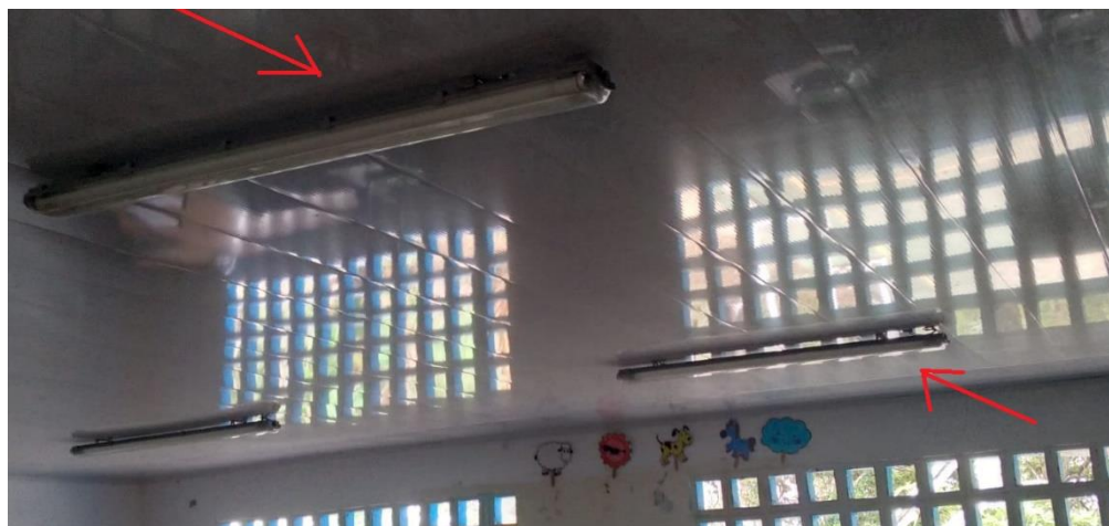
Imagen 23. Estado actual Sede Chapuro

En la visita de auditoría realizada a la Institución Educativa el Caguán, sede El Chapuro el 13 de febrero del 2023, por el quipo auditor de la contraloría municipal de Neiva y con la presencia del personal docente se evidenciaron que 14 lámparas no encienden debido a la falta del mantenimiento del circuito eléctrico, lo cual afecta el normal desarrollo de las clases por la oscuridad en el interior de las aulas, especialmente para días oscuros o nublados.